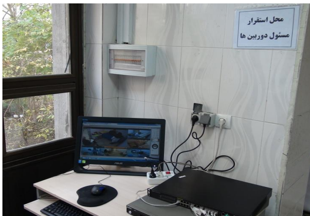
ثبت و ضبط برگزاری آزمون