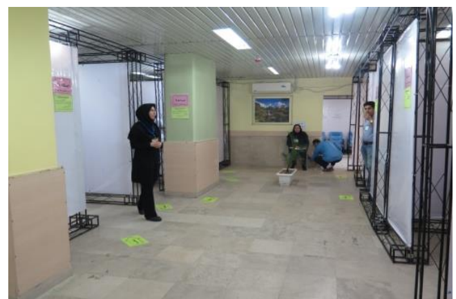
امکانات و شرایط فیزیکی صدا و نور مناسب در محل آزمون