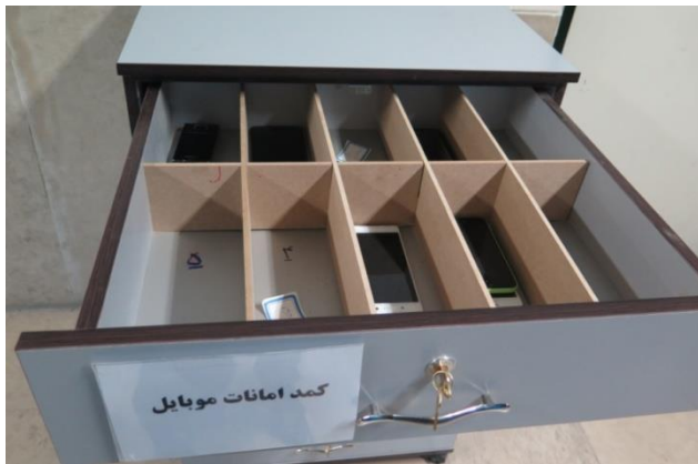
رعایت شرایط مناسب و مطلوب ارتباطات