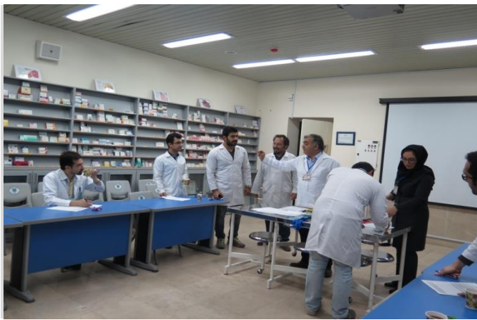
وضعیت خروج شرکت کنندگان از محل برگزاری آزمون پس از آزمون