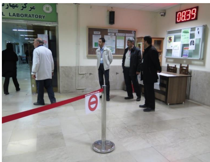
استقرار متصدی انتظامات آزمون