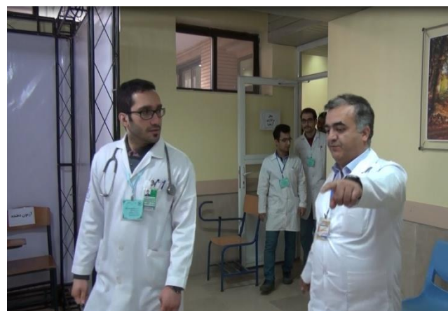
وضعیت ورود شرکت کنندگان به محل برگزاری آزمون