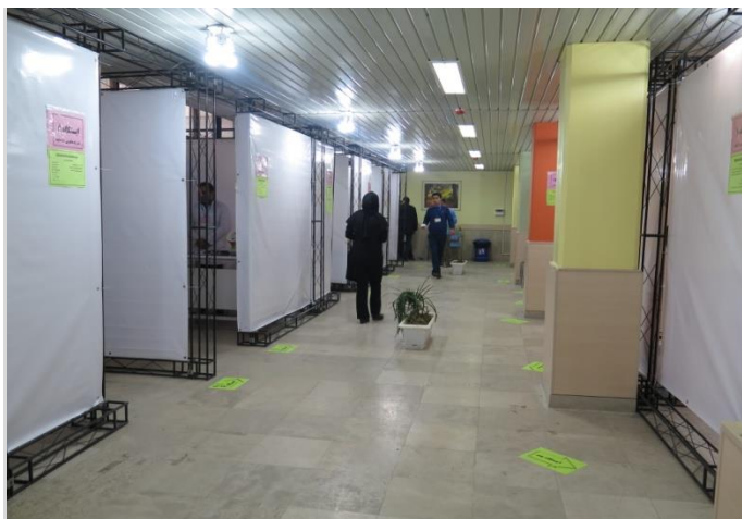
فاصله ایستگاه ها نسبت به یکدیگر به ترتیب شماره چرخش ایستگاهها