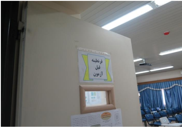
حضور شرکت کنندگان قبل از شروع آزمون