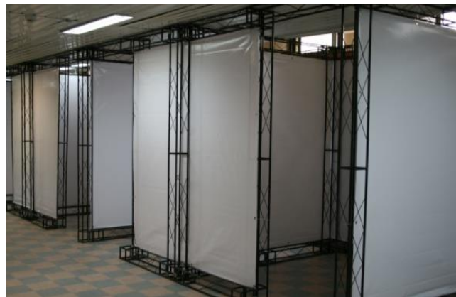
محل مشخص و مناسب با امکانات لازم و نحوه ارائه خدمات پشتیبانی