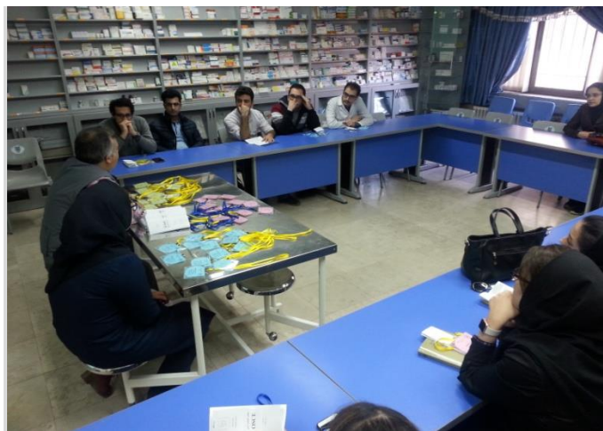
ارائه راهنمایی های لازم و کافی به شرکت کنندگان در آزمون / جلسه توجیهی قبل از روز برگزاری آزمون