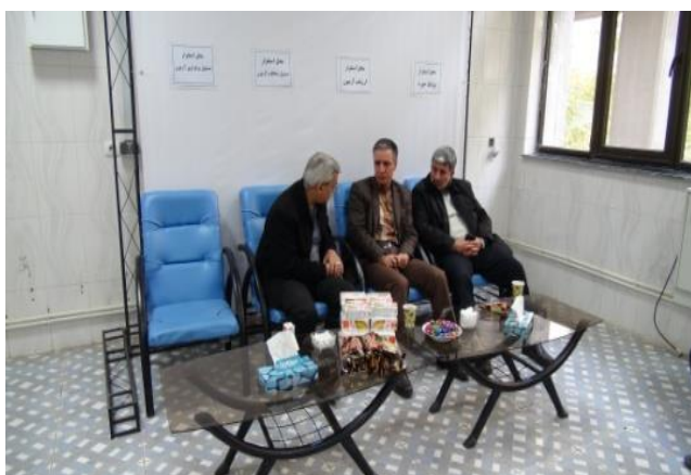
استقرار مسئول آزمون