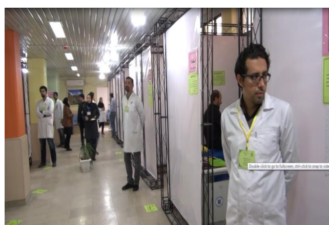
اعلام زمان چرخش بین ایستگاهها و اعلام زمان شروع آزمون