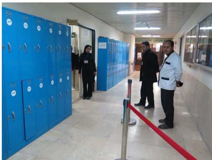
استقرار متصدی انتظامات آزمون