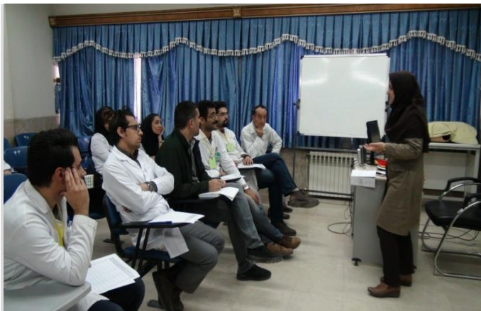
قرنطینه بعد از آزمون