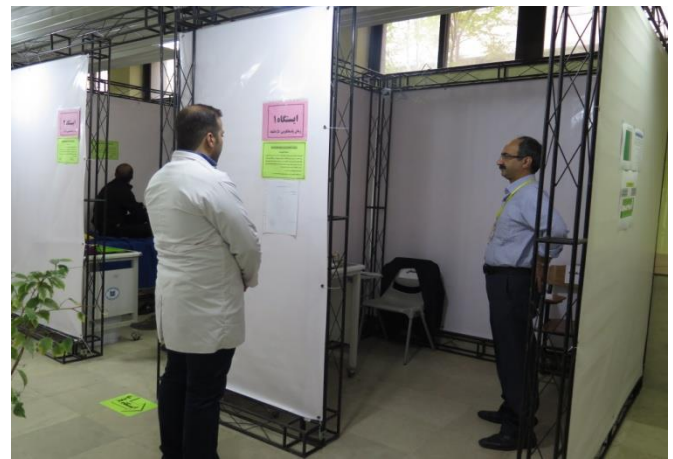
استقرار و فعالیت ناظرین، بیمارناها و ارزیابان ایستگاههای آزمون